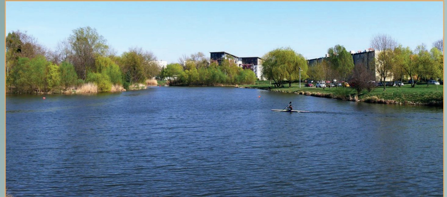
A városi Malom-tó

A parktavak üzemeltetése során Társaságunk gondoskodik a gerebrácsok ellenőrzéséről, az ott felgyülemlett hordalék, szemét kiszedéséről, elszállításáról, a vízszint ellenőrzéséről, a rézsúk állapotának vizsgálatáról, a keletkező hulladékok összegyűjtéséről, elszállításáról, eb egészségügyi zacskók kihelyezéséről, emellett szükség szerint gallyazásokat, rézsúk kaszálását végezte el. Ezen felül a Társaság rendszeresen közreműködik a sport-, illetve szabadidős célú tóhasználat, illetve a horgászati célú tevékenységek összehangolásában is.