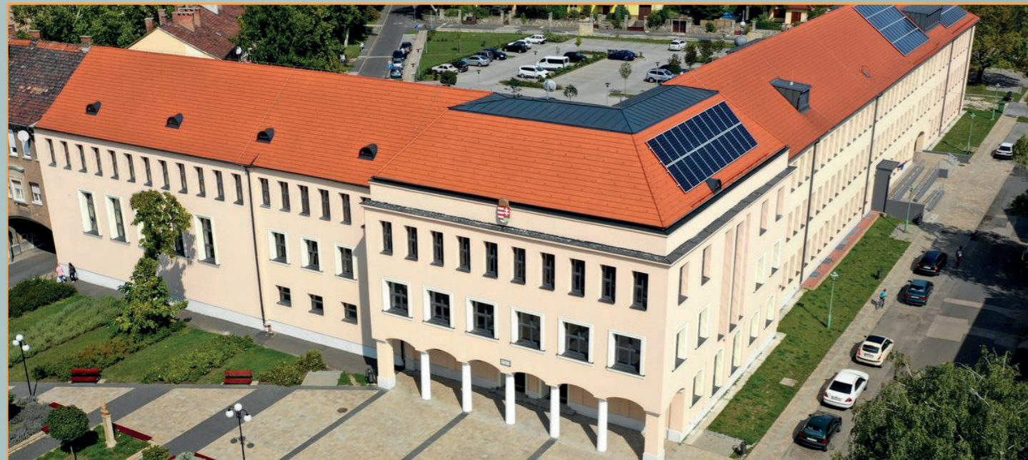
A Szolgáltató Városház központ épületegyüttese

Társaságunk üzemelteti az Alapító tulajdonát képező Szolgáltató Városház központban a Járási Hivatal irodahelyiségeit (Iskola utca).